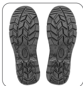
podešev outsole podeszwa