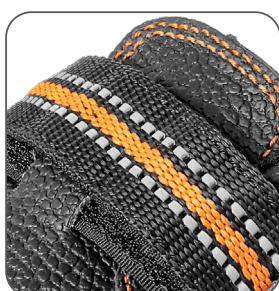
reflexní doplňky reflective accessories elementy odblaskowe